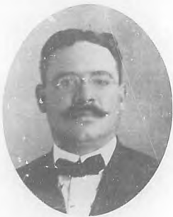
SR. PEDRO IGNACIO ZAYAS

nacio Zayas y Antonio Hidalgo, familiares de aquel, y personas de reconocidas aptitudes y sobradas relaciones lo mismo en Cuba que en los Estados Unidos, pusieron al lado del que tambaleaba y con él, compartiendo sus arrestos y actividades formaron un triunvirato que había de triunfar y que triunfó finalmente de manera sorprendente.