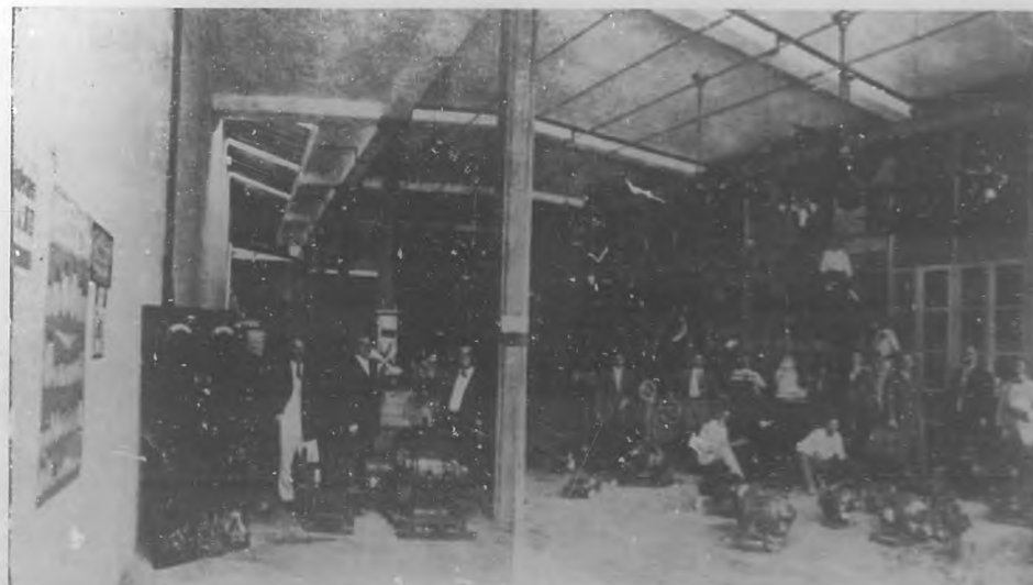
INTERIOR DE LOS ALMACENES DE LA "CUBA ELECTRIC SUPPLY CO."