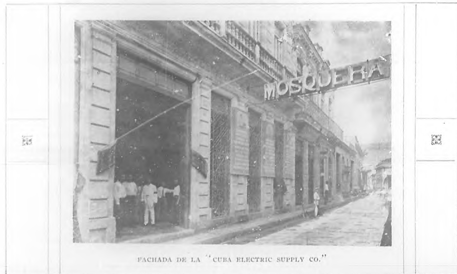
FACHADA DE LA "CUBA ELECTRIC SUPPLY CO."

Ha habido época en que no se concebía una casa de familia que no poseyera un aparato de esos, y el consumo de ellos á como de discos, llegó á representar una suma verdaderamente estupenda.