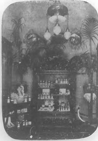
Salón D'Hygiene &amp; de Beauté.—Salón de espera.