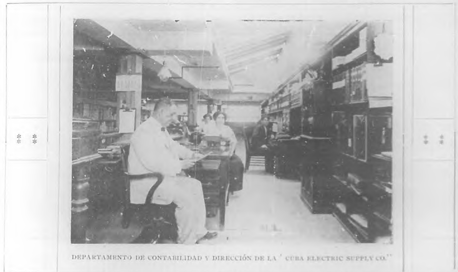
DEPARTAMENTO DE CONTABILIDAD Y DIRECCIÓN DE LA "CUBA ELECTRIC SUPPLY CO."

Y quisiéramos mover la pluma en su elogio, y poder decir de los mismos lo que del señor Mosquera que, empezando solo sus operaciones, viéndolas prosperar, viendo luego como decrecían en importancia hasta llegar á los más reducidos límites, no desmayó; y con un poderoso refuer-