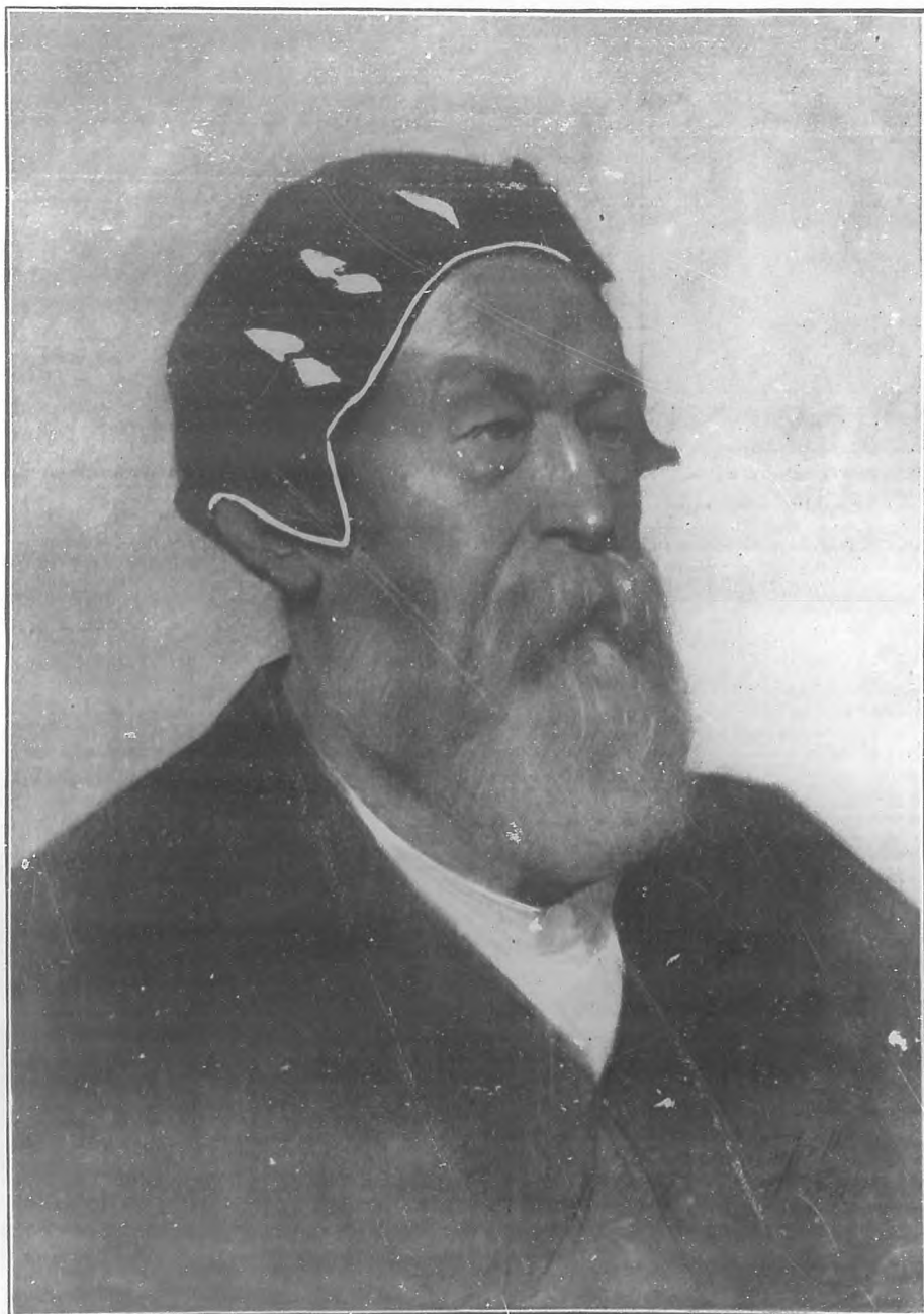
TIPO DE VIEJO ALEMAN

Notable dibujo del artista cubano, señor José Francisco Campillo.