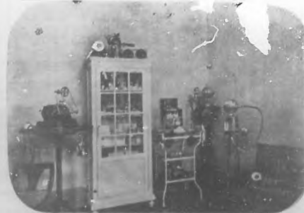
Salón D'Hygiene &amp; de Beauté.—Gabinete de Massage.