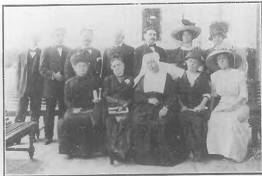
Grupo de Distinguidas damas y caballeros que forman parte de la Junta Pradosa de la Maternidad.