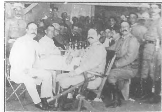
Mesa presidencial del almuerzo con que fué obsequiado el cuerpo de la Guardia Local de la Habana en el campamento de Columbia.