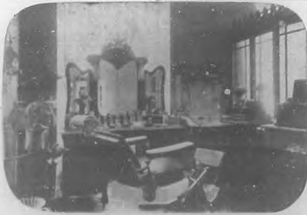
Salón D'Hygiene &amp; de Beauté.—Sala de tratamientos de la belleza.